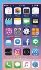
เลือก Settings (ตั้งค่า)