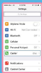
เลือก Carrier (ผู้ให้บริการ)