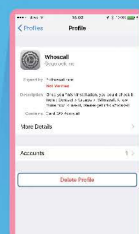
เลือก Delete Profile เพื่อกำจัด Profile นั้นออก โดยที่การ Profile จะหมด และ restart เครื่อง