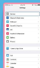
เลือก General (ทั่วไป)