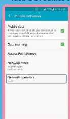
เลือก Network operators (ผู้ให้บริการเครือข่าย)