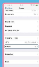
เลือก Profiles (โปรไฟล์)