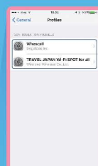
เลือก Profiles ที่มีอยู่ในเครื่องที่จะลบ