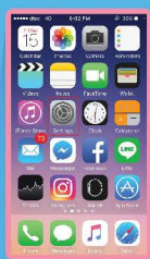
เลือก Settings (ตั้งค่า)