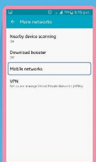
เลือก Mobile networks (เครือข่ายมือถือ)