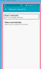
เลือก Search networks (ค้นหาเครือข่าย) และเลือกเครือข่ายที่ให้บริการ ในซิม GO! อินเตอร์ ตามตารางด้านล่าง