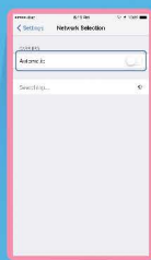
ปิด Automatic และเลือกเครือข่ายที่ให้บริการ ในซิม GO! อินเตอร์ ตามตารางด้านล่าง